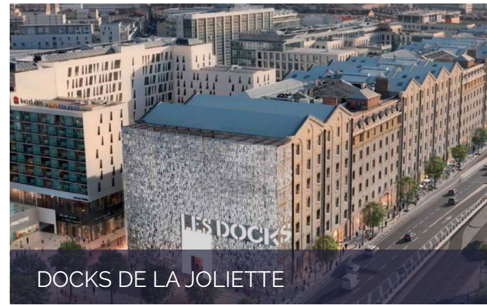
DOCKS DE LA JOLIETTE