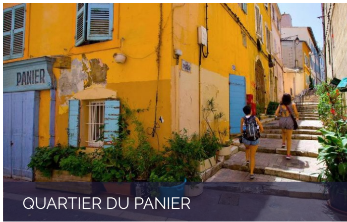
QUARTIER DU PANIER