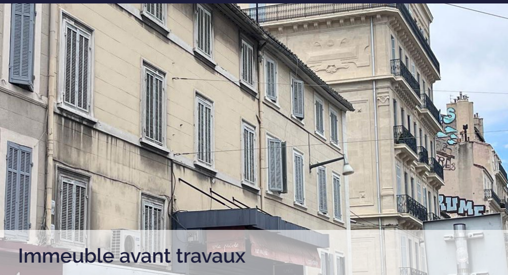
Immeuble avant travaux

Le projet « Via Roma » est une très belle réhabilitation d'un petit immeuble de 3 étages, idéalement situé dans un des arrondissements les plus recherchés de Marseille. Le programme est particulièrement bien desservi par les transports en commun.